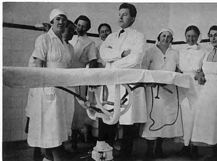
Skurðstovan á D. A. H.