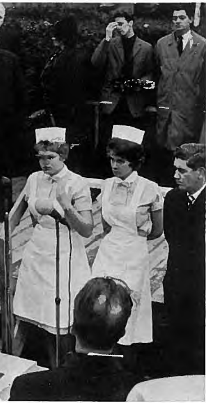
Grundasteinurinn verður lagður til Landssjúkra- húsið 19. júní 1962