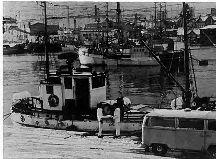
Reyðikrossur og Sjúkrabilurinn