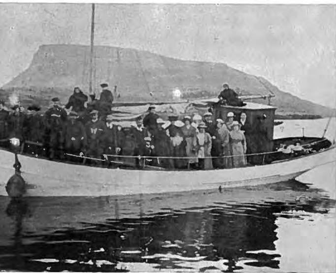
Útferð við gl. Reyðakrossi