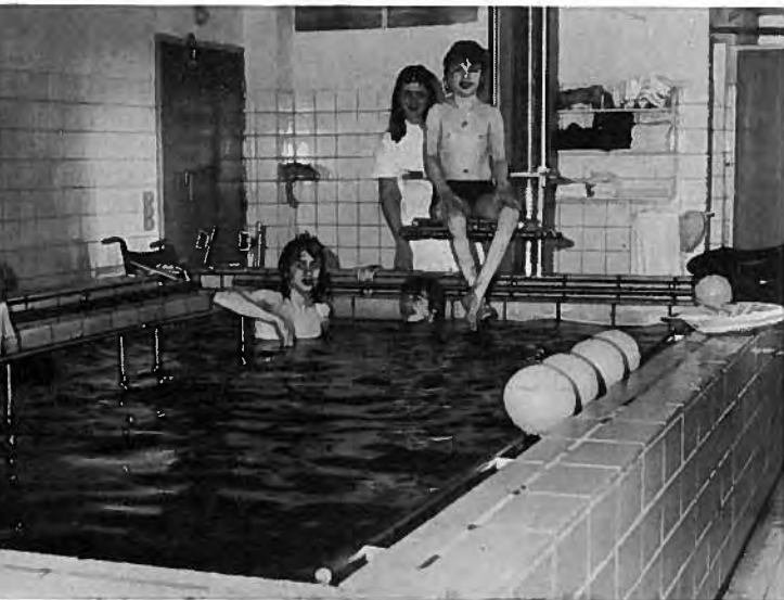
Uppvenjing í svimjihyli