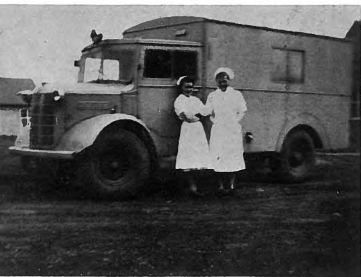
Sjúkrabilur frá kríggstíðini