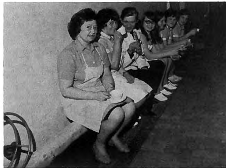
Kaffi á rørinum