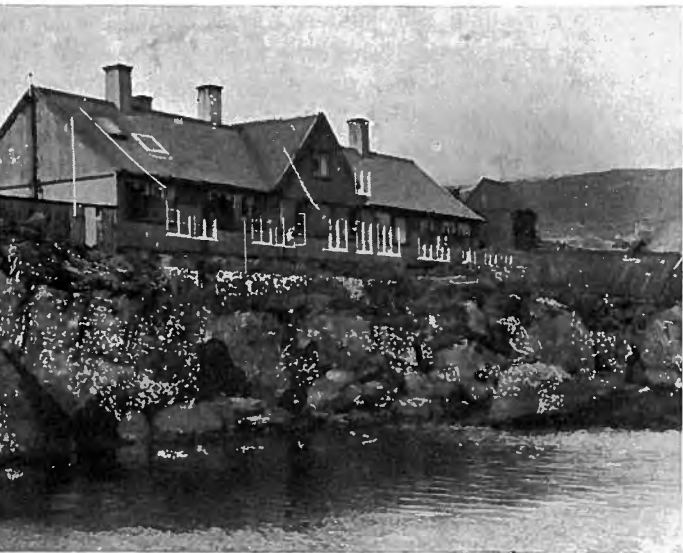
Færø Amts Hospital