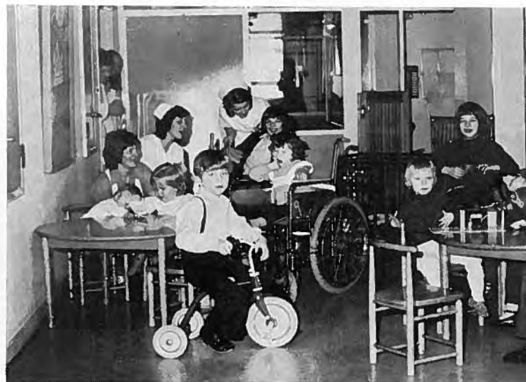
Barnatysjan á B 4