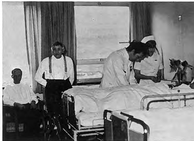
Sjúkrastova á B 5