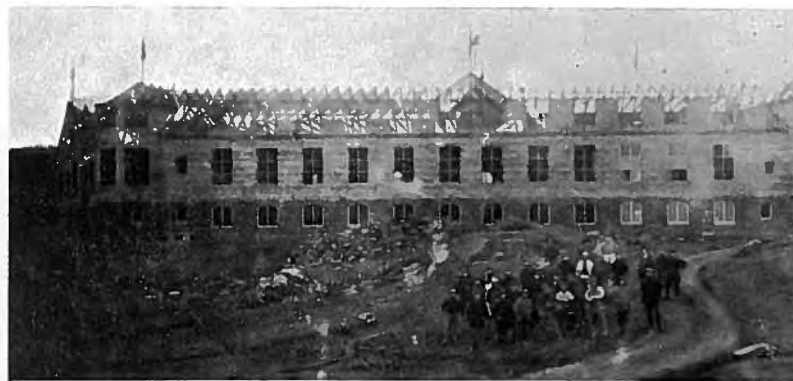
Dr. Alexandrines Hospital verður reist 28. mars 1923. 23. juni 1921 legði C grundasteinin ; iáttáðar vórðu 500.000 kr. til byggingina, men kom D. A. 475.000 kr.