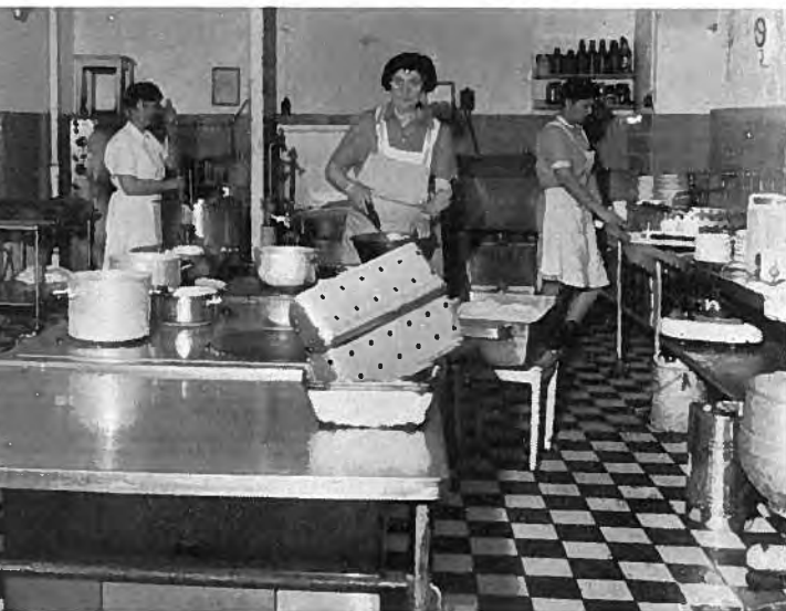
Køkurin á D. A. H.