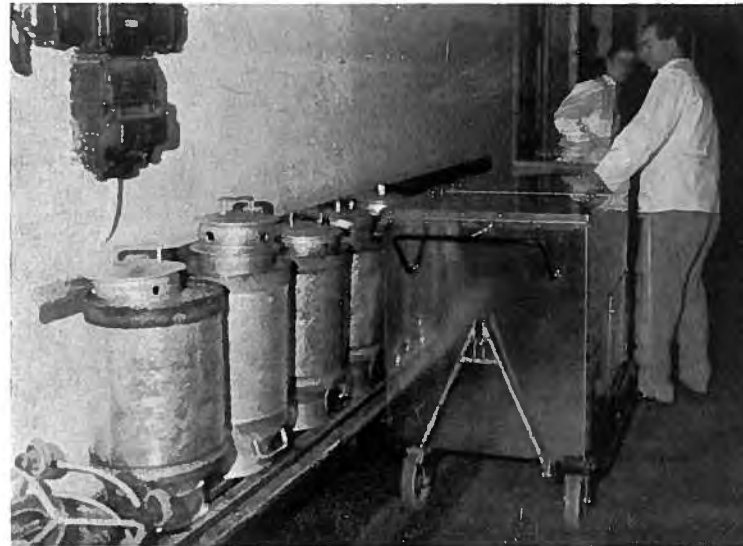
Matvognar í gomlu kjallaragongini